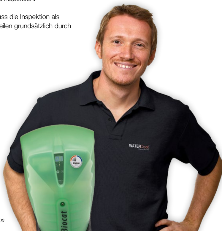
BIOCAT KS 3000

Damit alle Anforderungen regelkonform erfüllt werden können, bieten wir Ihnen als Lösung unseren Servicevertrag „ PREMIUM “ an. Dieser besteht aus der jährlichen Funktions- und Leistungsprüfung aller Geräte und Anlagenteile durch unseren Kundendienst sowie den Granulatwechsel/ 5-Jahres-Service. Abschließend erfolgt die vorschriftsmäßige Dokumentation und Eintragung im Inspektionsheft bzw. Betriebshandbuch (VDI 6023).